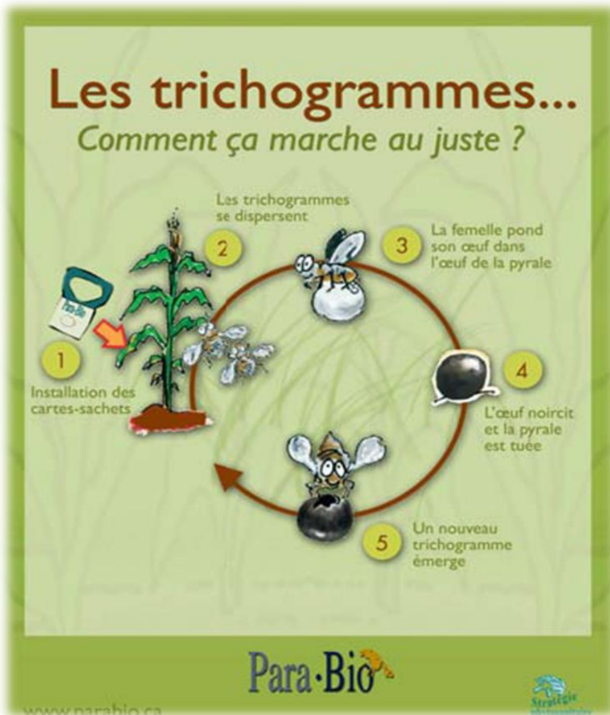
Fig.3 : Guide d'explication présenté par une compagnie fournisseuse de trichogrammes