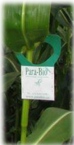
Fig. 4 : Trichocarte accrochée à un plan de maïs